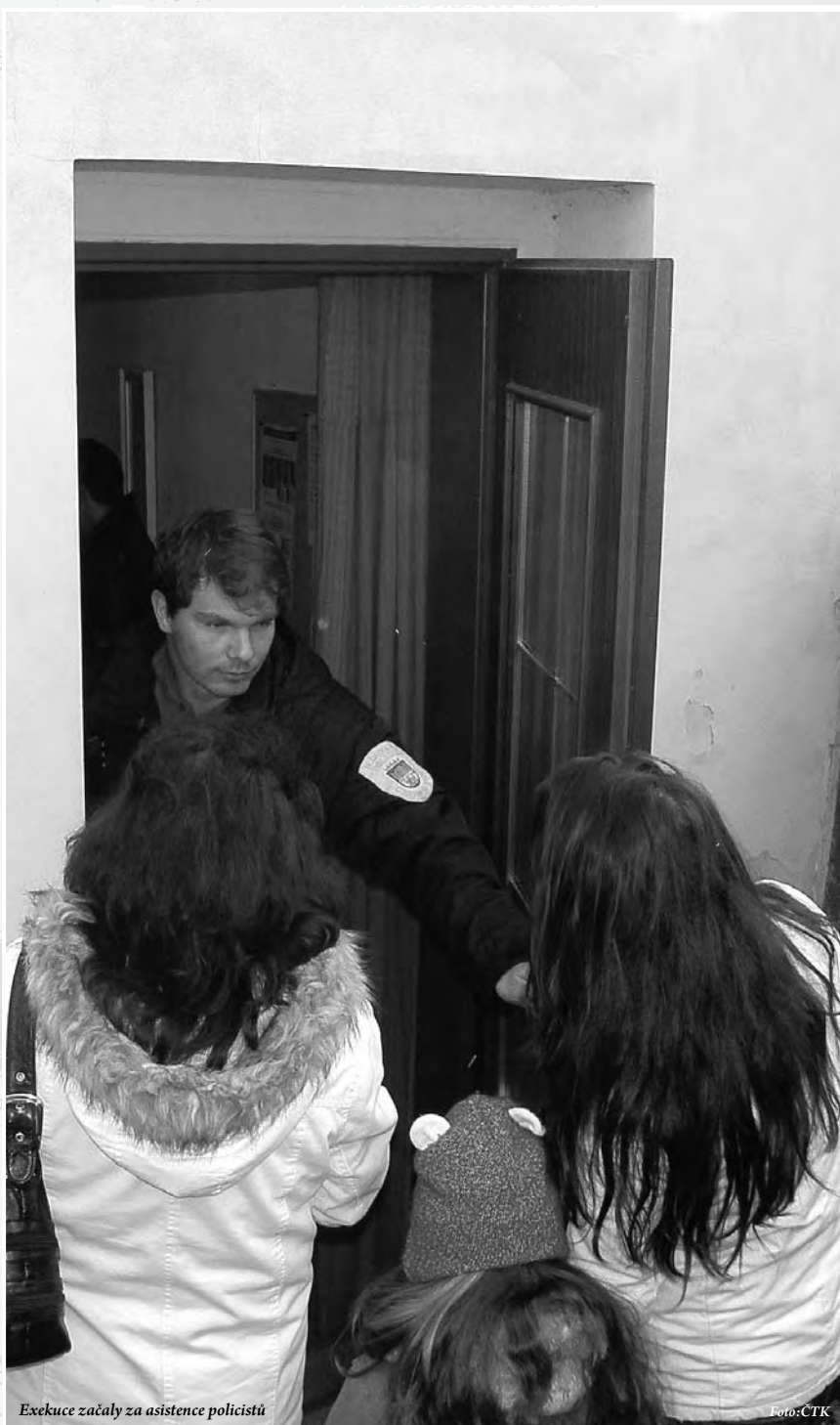
Exekuce začaly za asistence policistů

Dalšího porušení zákona se dopustila chomutovská městská policie tím, že médiím poskytla záběry z kamerového systému, který sledoval exekutorské zabavování dávek dlužníkům. Na toto (možné) porušení zákona upozornilo v dubnu sdružení ROMEA, na základě vyjádření