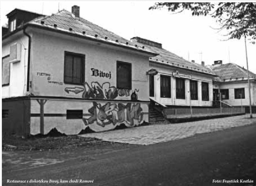
Restaurace s diskotékou Bivoj, kam chodí Romové