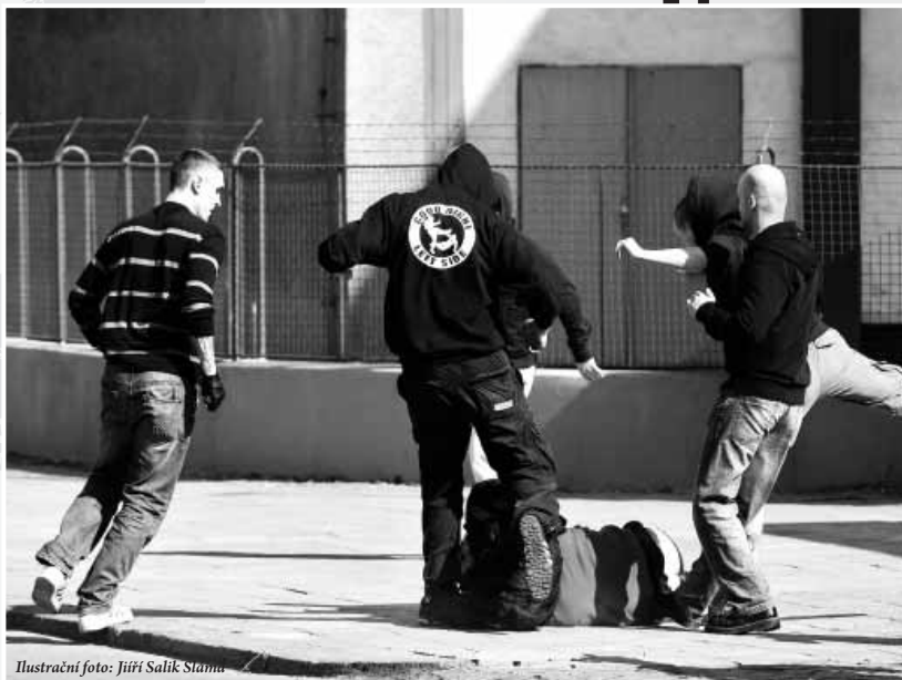
Ilustrační foto: Jiří Salík Štampa