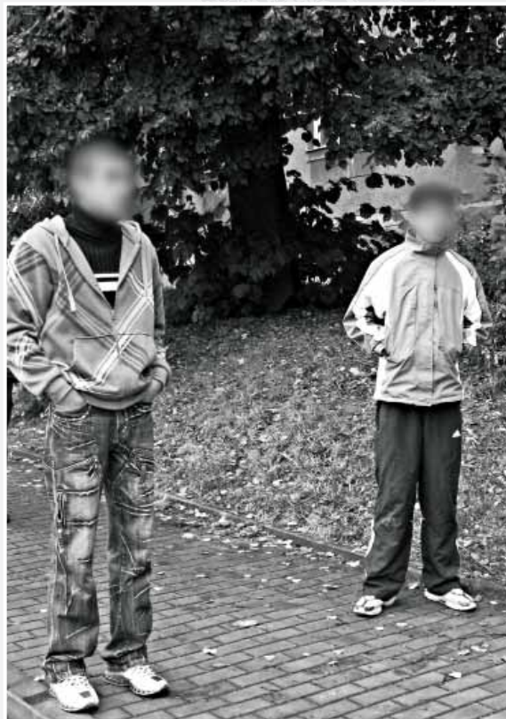
Oba romští mladíci na místě, kde je přepadli rasisti - rok poté