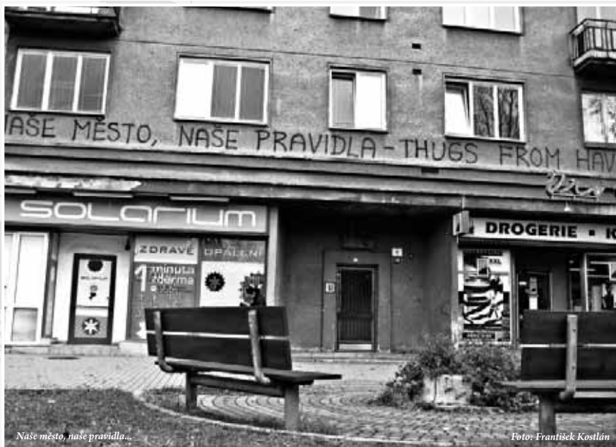
Naše město, naše pravidla...