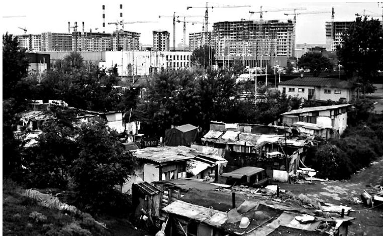
Hlavně zlepšit bydlení

Za další výsledek Dekády považují národní koordinátoři přijetí struktur pro koordinaci a sledování politik, zaměřených na zlepšení postavení Romů. Tak byla stvořena Rada pro zlepšení postavení Romů, jež se