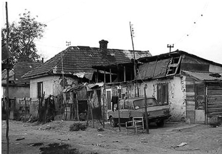
Mohlo by to být lepší. Ale jak?

Od zahájení Dekády podle Dokić výrazně vzrostl podíl Romů ve školách. V předškolním vzdělávání více než dvojnásobně, čtyřnásobně více dětí pak plní povinnou školní docházku. Střední školy navštěvuje