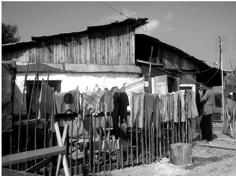
U nás konference nebyla...