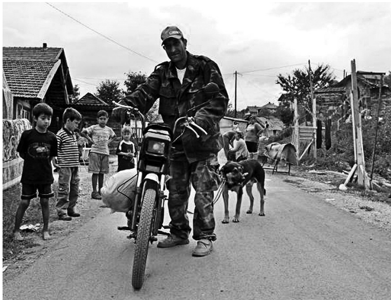
Vše ukáže čas