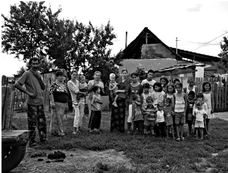
Předsednictví se povedlo. Ale co dál?

Většina romských rodin žije navíc segregovaně, a to buď v osadách anebo ve čtvrtích na okrajích měst s nedostatečně rozvinutou infrastrukturou. Špatnou situaci můžeme pozorovat i ve zdravotnictví. Délka života romské populace je o deset let kratší než na celonárodní úrovni. Takže ve všech sférách, které jsou prioritní