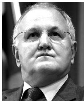
D. Čaplovič

Konference, semináře, olympiáda lidských práv. To je oficiální odpočet Slovenska, které od 1. července 2009 do 30. června 2010 předsedalo mezinárodnímu programu Dekáda romské inkluze 2005-2015. Za priority si Slovensko během předsednictví určilo integrované vzdělávání a multikulturní výchovu, identitu Romů a revizi národních akčních plánů.