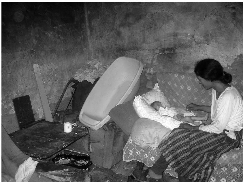
Další prioritou je odstranění chudoby a...

Co se týče evaluace, toto je opravdu jedno z nejslabších míst této iniciativy. Na začátku jsme se nebyli schopni dohodnout se na minimálních indikátorech měření pokroku. Chápu, že je to komplikované, ale bez toho se těžko změní, kam se situace Romů v jednotlivých státech za deset let posunula. Každý stát takové indikátory sice uvádí ve svých NApěch, ale toto nám nedává možnost srovnání. Právě proto, že neexistují společné indikátory a evaluační mechanismus, měření realizace jednotlivých NAPů se míchá s měřením národních strategií. Pamatuji se, že několik let jsme byli jediným státem, který vládě předkládal zprávu o naplňování NAPu. Ač se to zdá jako byrokratický krok, toto