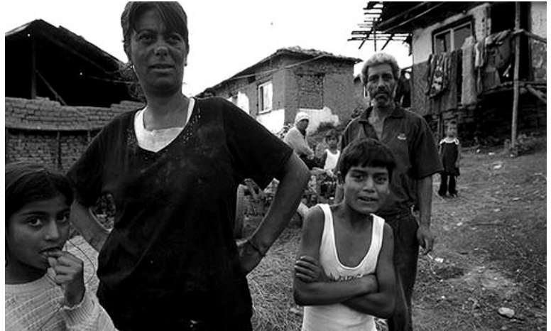
Demolice osad nic nevyřeší

V rámci Ministerstva školství, mládeže a vědy bylo roku 2005 založeno Centrum pro integraci ve vzdělání dětí a studentů etnických minorit (CVIDS), jež realizovalo celkem 28 projektů orientovaných na rovný přístup ke kvalitnímu vzdělání dětí a studentů etnických minorit. Od svého založení až po současnost finančně podpořilo