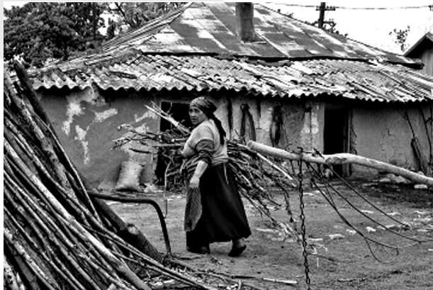
Dekáda? Co to je?