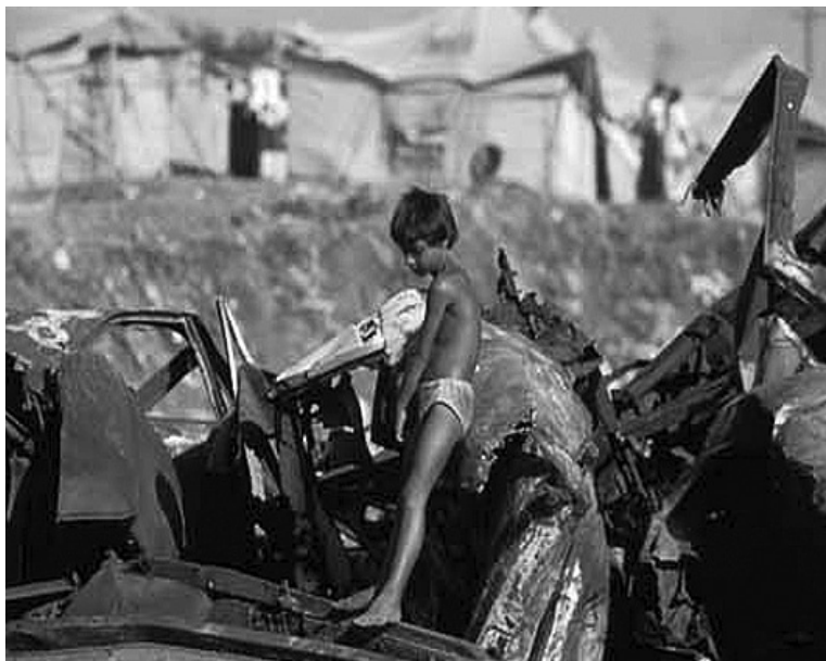
Chlapec v uprchlickém táboře kosovských Romů

Specifickým problémem země je přítomnost množství uprchlíků a vysídlených (IDP - internally displaced persons), kterým země poskytla během ozbrojených konfliktů v regionu útočiště. V Černé Hoře se stranou hlavního města Podgorici nachází největší uprchlický tábor na území Balkánu, který je v současné době do-