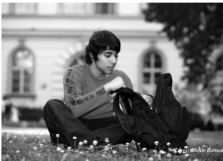
Jednou ze základních priorit Dekády je dostupné a kvalitní vzdělání pro každého

Už jsem zmínil, že za jednoznačná pozitiva považuji, že se 12 vlád pravidelně schází a rozvíjí téma romské integrace společně s Romy. Jsou schopny koordinovat své postupy při tlaku na dosažení cílů Dekády, a to není zdaleka málo. Důležitým aspektem Dekády je jednoznačně solidarita mezi zeměmi, které řeší v podstatě stejné problémy.