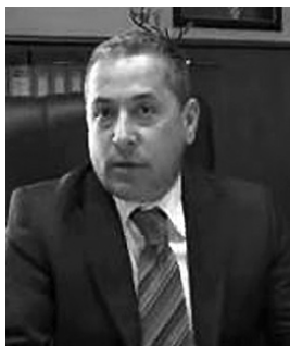
Spiro Ksera

Albánská vláda měla sice ještě před vstupem do Dekády romské inkluze vlastní strategii, jak zlepšit situaci romské menšiny. Na její realizaci však nebyly peníze. Teď to vypadá o něco nadějněji, přesto vše je na začátku a situace albánských Romů j opravdu tíživá.