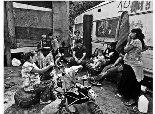
Španělští Romové jsou na tom asi nejlépe

klad. Je totiž jednou z mála evropských zemí, kde se životní podmínky poměrně velké romské populace za poslední dvě desetiletí nesporně zlepšily. Lze říci, že před dvaceti lety na tom byli španělští Romové hůře než čeští: měli vysokou míru negratnosti a jen minimum jich vykonávalo regulérní zaměstnání. Většina žila v chatrčích a nacházela obživu, tak jako po celé předchozí generace, jen v sektoru šedé ekonomiky.