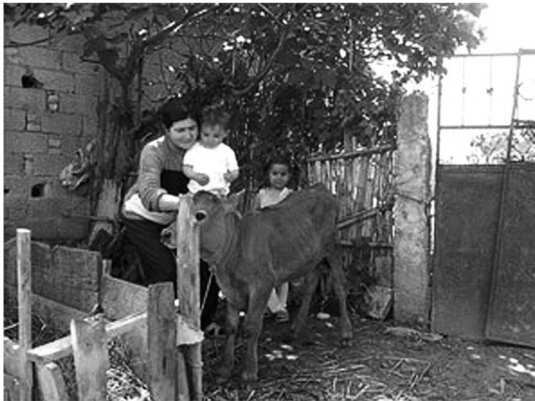
Na konkrétní výsledky čekáme

UNDP upozorňuje také na špatnou dostupnost zdravotní péče pro mnoho romských rodin, a na fakt, že mnoho dětí z početných rodin trpí podvýživou. Podle údajů Světové banky z roku 2003 pouze 39 % celkové albánské populace mělo zdravotní pojištění, konkrétní číslo u Romů se předpokládá ještě několikanásobně nižší. Oficiální albánské zdroje uvádějí, že Romové se dožívají v průměru až o deset let méně než majorita.